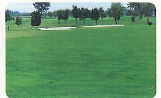
フェアリーリング病