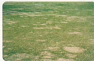
疑似葉腐病 (春はげ症)