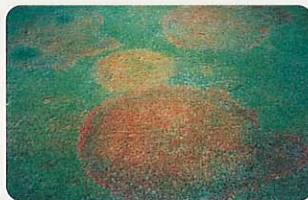
葉腐病 (ブラウンパッチ)