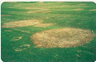
葉腐病 (ラージパッチ)