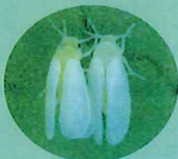
タバココナジラミ