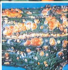
アカマルカイガラムシ