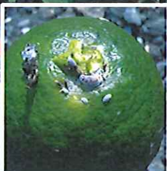
フジコナカイガラムシ