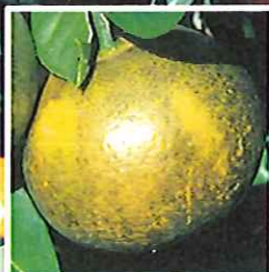
ミカンサビダニ による被害果