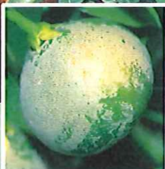
チャノホコリダニ による被害果