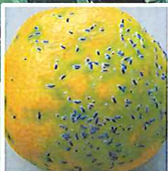
ヤノネカイガラムシ