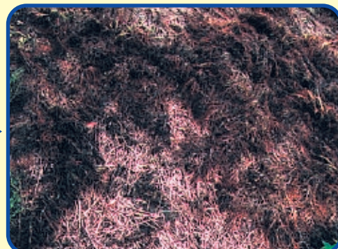
はやわさ (100倍希釈液) [但し翌春再生]