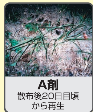
A剤 散布後20日目頃 から再生