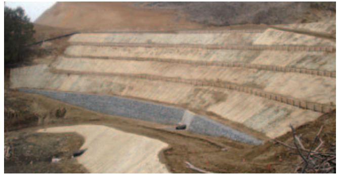
福島県伊達郡川俣町