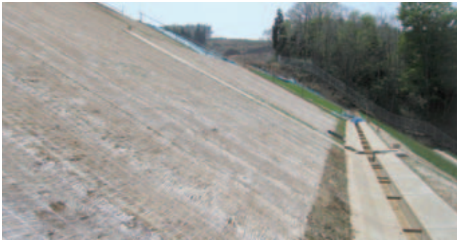
青森県上北郡野辺地町