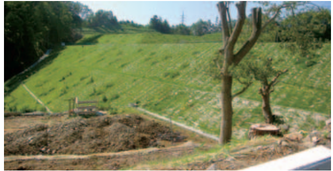
長野県下伊那郡阿南町